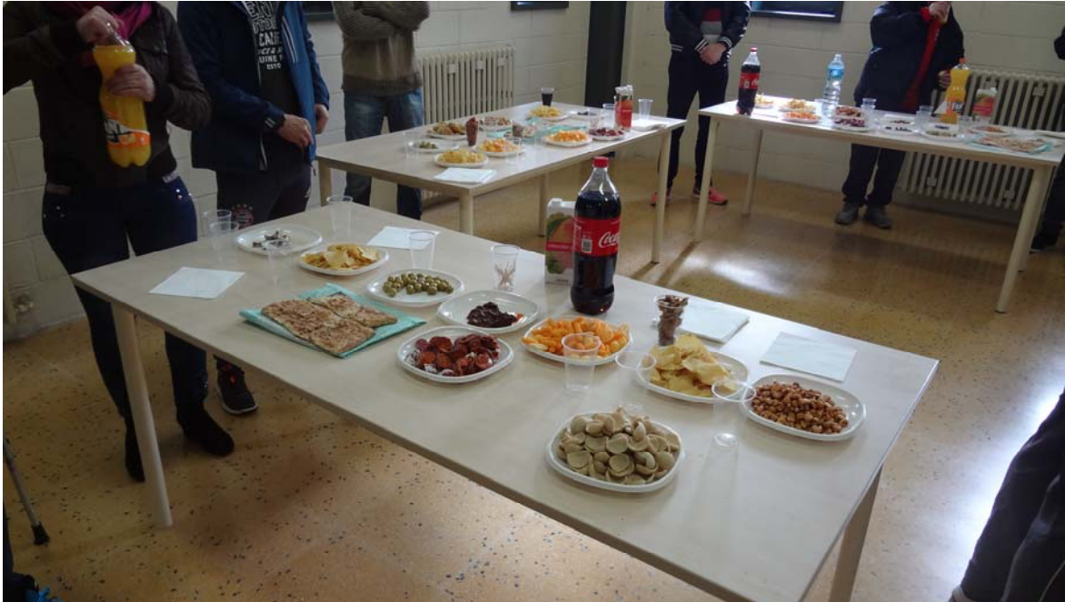
El pica-pica de celebració.

Acte seguit tots junts varem gaudir d'un pica-pica d'aniversari, en que varem aprofitar per aplegar sinèrgies, compartir il·lusions de futur i prendre el ferm compromís de seguir treballant pels escacs i per potenciar totes les activitats orientades a la reinserció de que puguem dotar als interns.