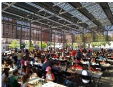
Fotografia dels alumnes del programa "Escacs a les aules"

El passat divendres 8 de juny, més de 400 alumnes de 2on curs de primària es van reunir a la plaça Catalunya de Figueres per celebrar la Festa de Cloenda de la 6 a edició del programa Escacs a les Aules. Hi van participar les escoles del Parc de les Aigües, Josep Pallach, Sant Pau, Escolàpies, Cor de Maria, Amistat, Dalí, Carme Guasch i M a Àngels Anglada. Per quarta vegada aquesta cloenda tenia lloc en horari lectiu, cosa que va permetre reunir un gran nombre de participants.