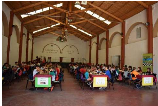
Vista general del local de joc

L'objectiu de la trobada era promoure la convivència entre els alumnes de diferents centres, fomentar valors, donar a conèixer referents del món escaquístic català i fer que els alumnes gaudeixin a través dels escacs.