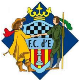
Federació Catalana d'Escacs