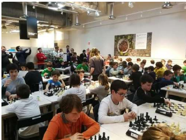
IKEA Badalona, on se celebrà la final